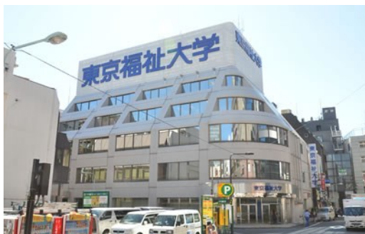
東京福祉大学池袋キャンパス9号館

教材工夫展終了後、サンシャイン60の59階「天空の庭 星のなる木」で研究会創立30周年記念パーティーを行います。参加ご希望の方は8月18日までにkisoedu@yahoo.co.jp（幹事宛）に住所・氏名と共にご一報下さい。会費はお一人様5000円です。